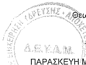
ΠΑΡΑΣΚΕΥΗ ΜΠΑΡΤΣΙΔΗ ΑΓΡ. ΤΟΠΟΓΡΑΦΟΣ ΜΗΧ/ΚΟΣ, MSc ΤΕΧΝΙΚΟΣ ΔΙΕΥΘΥΝΤΗΣ ΔΕΥΑΜ