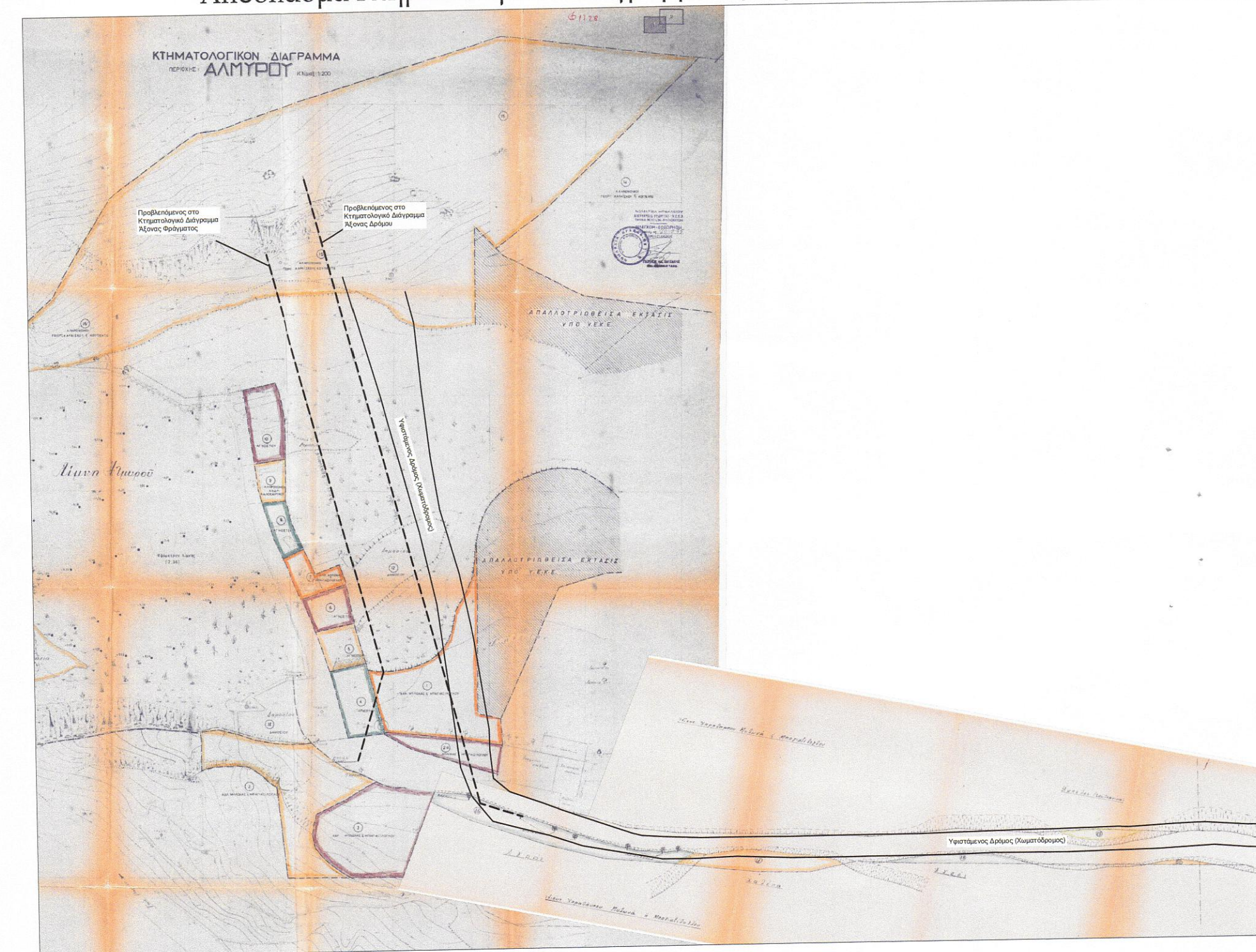
Απόσπασμα Κτηματολογικού Διαγράμματος περιοχής κλ: 1/1000